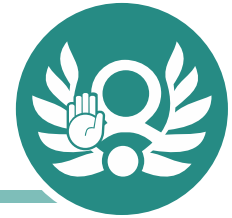
Percepción sobre frecuencia de corrupción en los estados