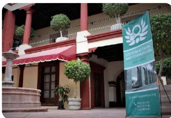
Hidalgo #38 Centro Histórico, Querétaro, Qro.